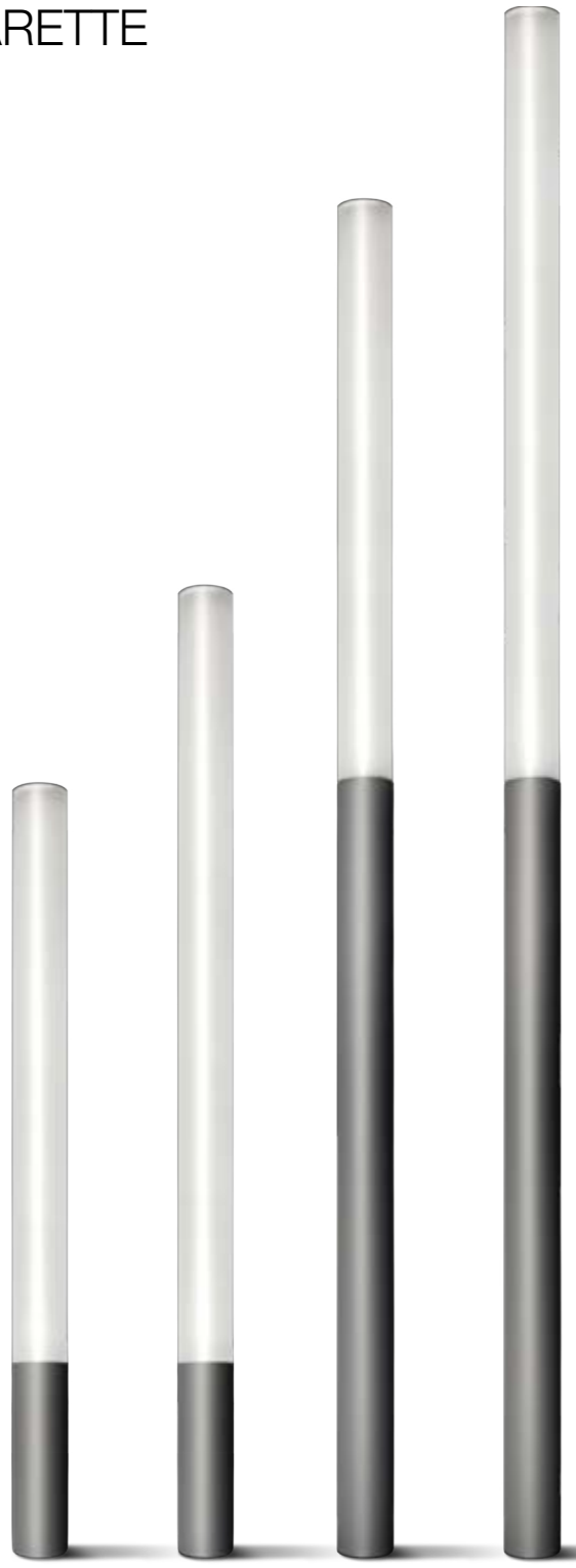
S.2002W S.2003W S.2012W S.2013W